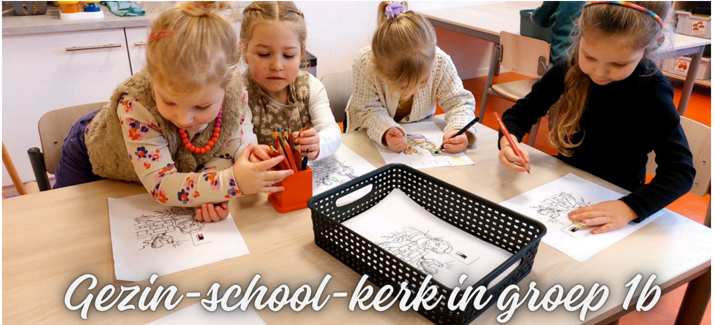
Gezin-school-kerk in groep 1b

NIEUWSBRIEF VAN DE PAASBERGSCHOOL - 30 JANUARI 2026